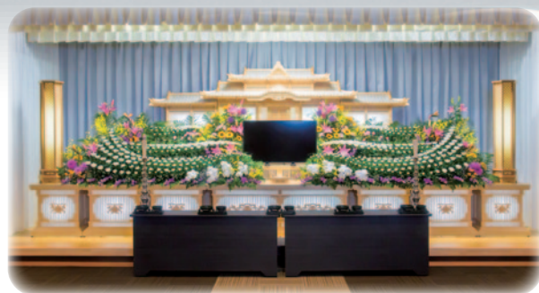
やすらぎの間 (約120名)