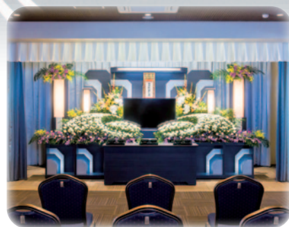
いにしえの間 (約50名)